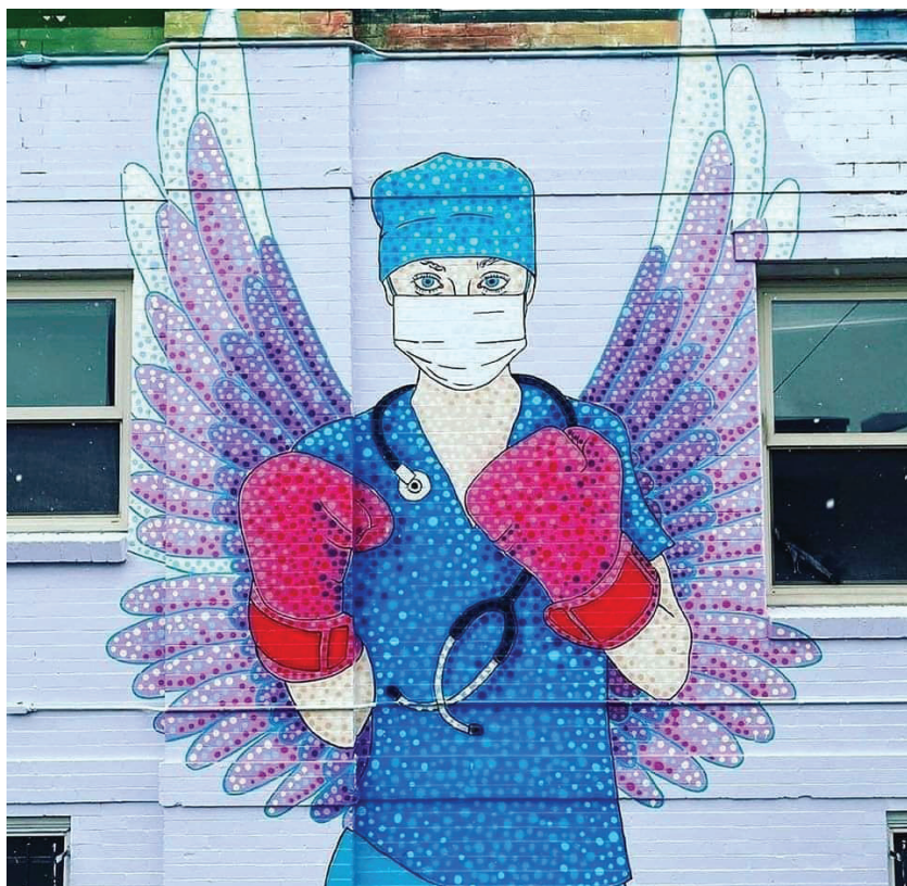
Mural de una enfermera luchando contra la pandemia de COVID-19. Austin-Zucchini Fowler, Denver, Colorado USA. 2020.