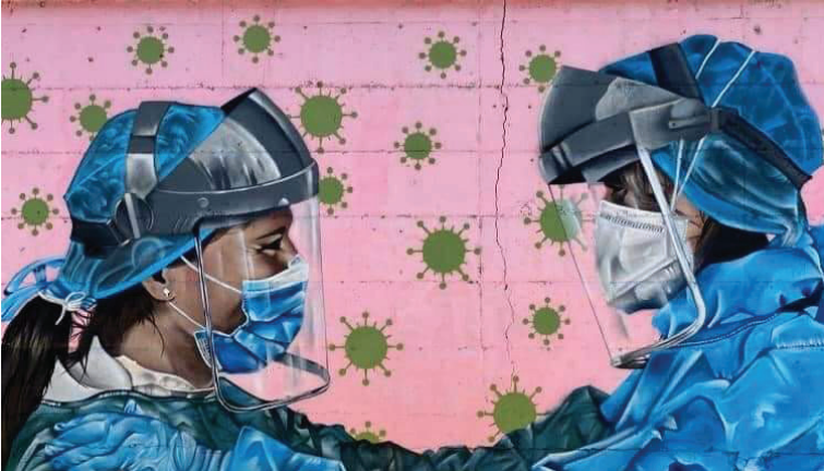
Pajuelo. 2020.